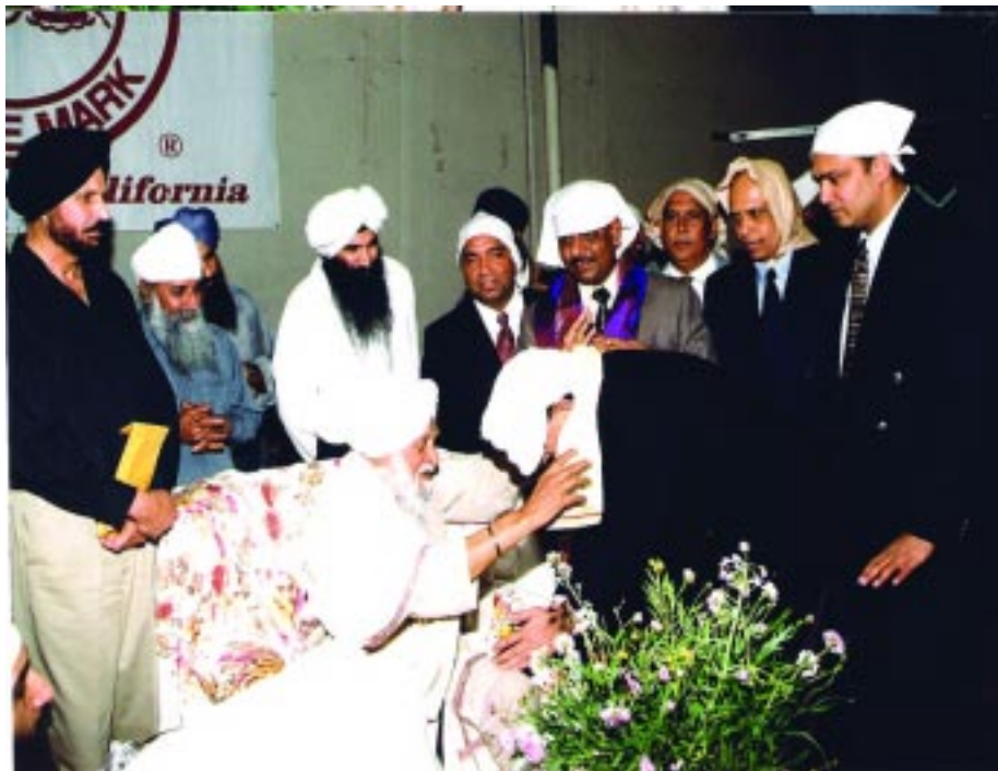
ਸੰਤ ਮਹਾਰਾਜ ਸਿਰੋਪੇ ਦੇ ਕੇ ਨਿਵਜਦੇ ਹੋਏ।

ਗੁਰਮਤਿ ਵਿਚ ਵੀ ਗਿਆਨ ਮਾਰਗ ਦੇ ਪੱਧਰ ਦਾ ਤੇ ਦਰਸਾਂਦੀ ਦਿਸ਼ਾ