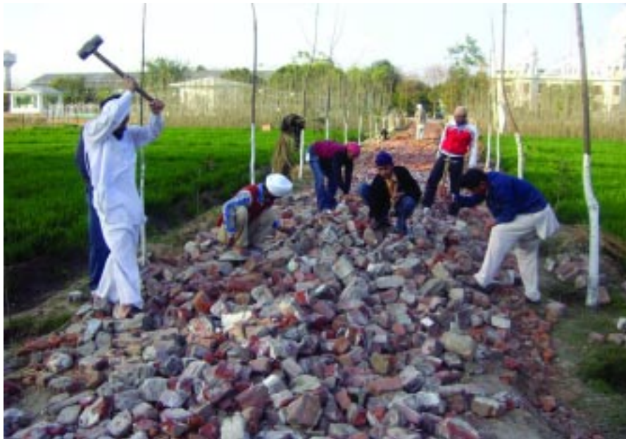
ਗੁ. ਈਸ਼ਰ ਪ੍ਰਕਾਸ਼ ਰਤਵਾੜਾ ਸਾਹਿਬ ਵਿਖੇ ਚਲ ਰਹੀ ਸੜਕ ਕਾਰਸੇਵਾ ਦ੍ਰਿਸ਼। ਸੰਗਤਾਂ ਸੇਵਾ ਵਿਚ ਹਿੱਸਾ ਪਾ ਰਹੀਆਂ ਹਨ।