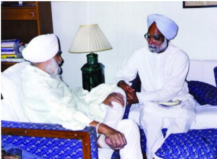
ਡਾ. ਮਨਮੋਹਨ ਸਿੰਘ ਪ੍ਰਧਾਨ ਮੰਤਰੀ ਮਹਾਂਪੁਰਖਾਂ ਨਾਲ ਦਿੱਲੀ ਅਸਕੋਰਟ ਹਸਪਤਾਲ ਵਿਖੇ ਕੋਈ ਅਹਿਮ ਵਿਚਾਰ ਕਰਦੇ ਹੋਏ।

ਨਾਨਕ ਸਤਿਗੁਰਿ ਭੋਟਿਐ ਪੂਰੀ ਹੋਵੈ ਜੁਗਤਿ ॥ ਹਸੰਦਿਆ ਖੇਲੰਦਿਆ ਪੈਨੰਦਿਆ ਖਾਵੰਦਿਆ ਵਿਚੇ ਹੋਵੈ ਮੁਕਤਿ ॥ ਅੰਗ - ੫੨੨