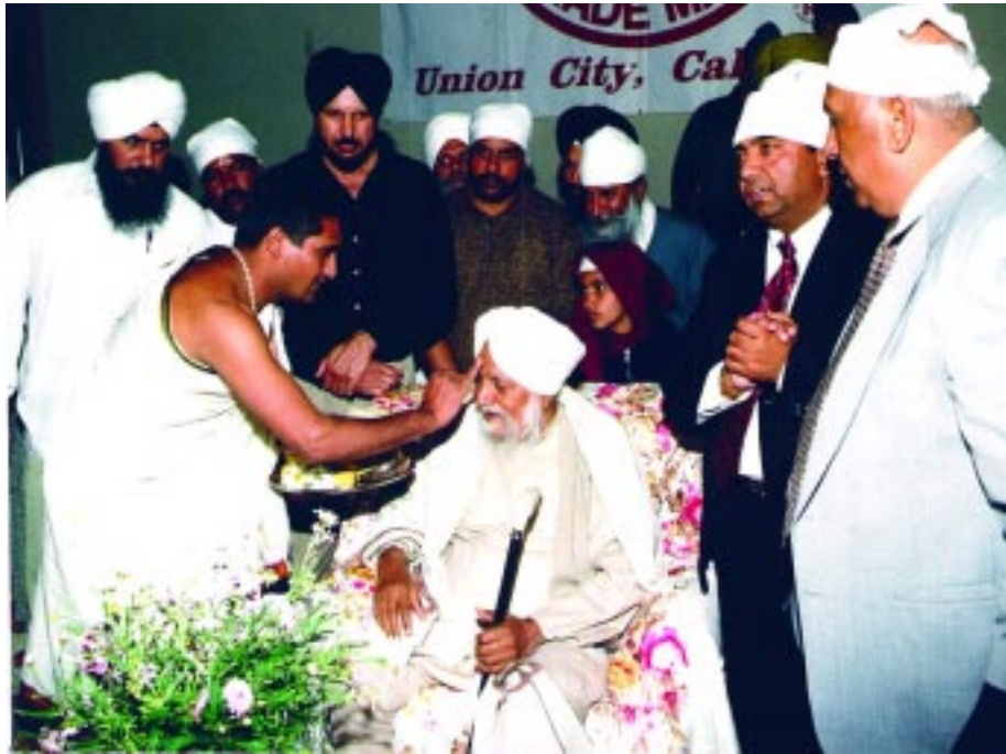
ਸਨੀਵੇਲ ਟੈਂਪਲ ਅਮਰੀਕਾ ਵਿਖੇ ਮੰਦਰ ਦੇ ਪੁਜਾਰੀ ਆਪਣੇ ਧਰਮ ਮੁਤਾਬਿਕ ਸੰਤ ਮਹਾਰਾਜ ਜੀ ਨੂੰ ਪਿਆਰ ਭਾਵਨਾ 'ਚ ਬੰਨ੍ਹਦੇ ਹੋਏ।

ਵਿਚ ਸਾਨੂੰ ਰਾਗ ਦਿਖਾਣ ਦੀ ਪੁਰਜੋਰ ਕੋਸ਼ਿਸ਼ ਕੀਤੀ। ਅੱਜ ਵੀ ਉਨ੍ਹਾਂ ਦੀਆਂ ਹਜ਼ਾਰਾਂ ਵੀਡੀਓ ਫਿਲਮਾਂ ਸਾਨੂੰ ਮਾਰਗ ਦਿਖਾਉਣ ਦੀ ਸਮਰੱਥਾ ਰੱਖਦੀਆਂ ਹਨ। ਕਿਤਨਾ ਸਮਾਂ ਅਸੀਂ ਉਨ੍ਹਾਂ ਨਾਲ ਰੂ-ਬ-ਰੂ ਵੀ ਹੋਏ ਤਾਂ ਕਿਉਂ ਅਸੀਂ ਉਸ ਆਨੰਦ ਦੀ ਪ੍ਰਾਪਤੀ ਤੋਂ ਵਾਂਝੇ ਹਾਂ ਜਿਸਨੂੰ ਅਸੀਂ ਗਾਉਂਦੇ ਤਾਂ ਹਾਂ ਪਰ ਪਾਉਂਦੇ ਨਹੀਂ।