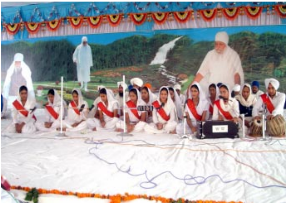
ਗੁਰੂ ਗੋਬਿੰਦ ਸਿੰਘ ਵਿਦਿਆ ਮੰਦਰ ਰਤਵਾੜਾ ਸਾਹਿਬ ਦੇ ਬੱਚੇ ਸਮਾਗਮ ਸਮੇਂ ਕੀਰਤਨ ਕਰਦੇ ਹੋਏ।

ਤਰ੍ਹਾਂ ਹਾਲਾਤਾਂ ਨੂੰ ਜ਼ਿੰਮੇਵਾਰ ਠਹਿਰਾਇਆ ਜਾਵੇ ਜਾਂ ਕਿਸੇ ਹੋਰ ਨੂੰ। ਬਾਣੀ ਵਿਚ ਵੀ ਫੁਰਮਾਨ ਹੈ -