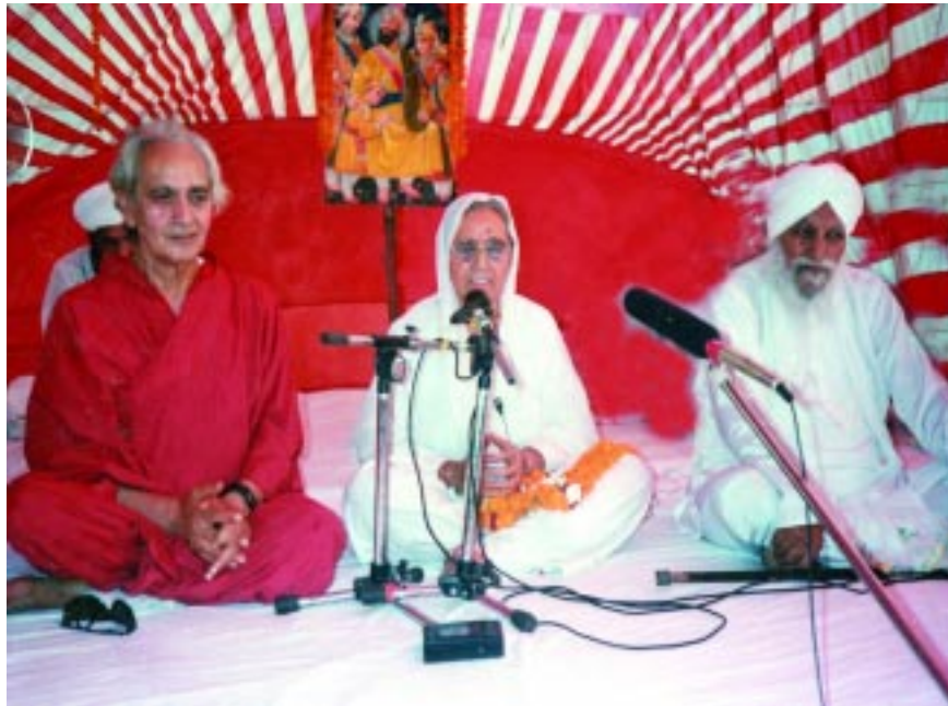
ਪਰਮ ਸਤਿਕਾਰਯੋਗ ਬੀਜੀ ਦੇਹਰਾਦੂਨ ਜੌਲੀਗਰਾਂਟ ਵਿਖੇ ਪ੍ਰਬਚਨ ਕਰਦੇ ਹੋਏ।

ਜਾਣਿਆ ਗਿਆ। ਬੁੱਧ ਮਤਿ ਦੇ ਧਾਰਨੀਆਂ ਨੂੰ ਉਸ ਦਾ ਇਕ ਮੁੱਖ ਉਪਦੇਸ਼ ਸੀ - 'ਅਪੋ ਦੀਪੋ ਭਵੋ' ਭਾਵ ਆਪਣੇ ਦੀਵੇ ਖੁਦ ਬਣੋ। ਗਿਆਨ ਮਾਰਗ ਦੀ ਪਰੰਪਰਾ ਵਿਚ ਬੁੱਧ ਦਾ ਕਾਫੀ ਯੋਗਦਾਨ ਹੈ। ਇਸ ਮਤਿ ਦਾ ਇਕ ਚੇਲਾ ਆਪਣੇ ਗੁਰੂ ਦੇ ਘਰ ਵਿਦਿਆਰਥੀ