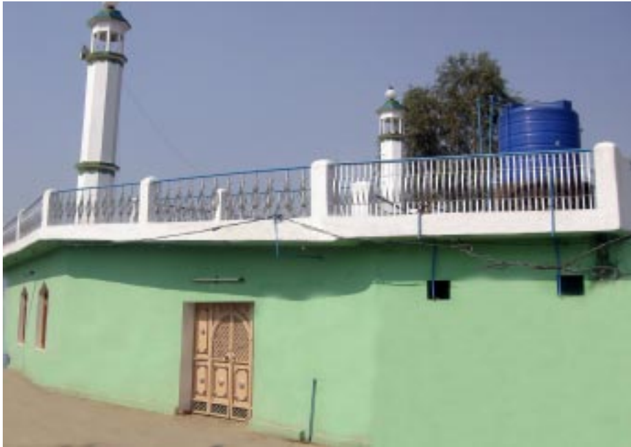
ਪਿੰਡ ਚਾਹਤਮਾਜਰਾ ਵਿਖੇ ਮਹਾਂਪੁਰਖਾਂ ਵੱਲੋਂ ਬਣਾਈ ਗਈ ਮਸਜਿਦ ਦੀ ਇਕ ਤਸਵੀਰ।