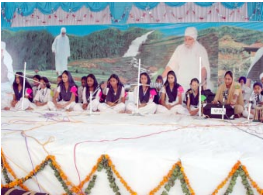
ਸੰਤ ਵਰਿਆਮ ਸਿੰਘ ਮੈਮੋਰੀਅਲ ਪਬਲਿਕ ਹਾਈ ਸਕੂਲ ਦੇ ਬੱਚੇ ਸਮਾਗਮ ਸਮੇਂ ਕੀਰਤਨ ਕਰਦੇ ਹੋਏ।

ਵਿਚ ਚੋਰੀ ਕਰਨ ਦੀ ਕੋਸ਼ਿਸ਼ ਕੀਤੀ। ਖਿੜਕੀ ਸਮੇਤ ਹੇਠਾਂ